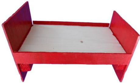
Ovansidan av sängen.

Sängen är röd (i boken är det en blå spjålsäng) och gjord av små bitar trälist och tunn playwood. Täcket är en bit teddytyg med en remsa spets påsydd som dekoration. Kudden är sydd av en bit tyg och har en liten tunn skumgummibit som fyllning. Madrassen är bara en bit vit filttyg.